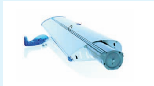
Enkeltå bytte motiv.