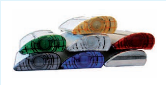
Finnes i 7 ulike farger.